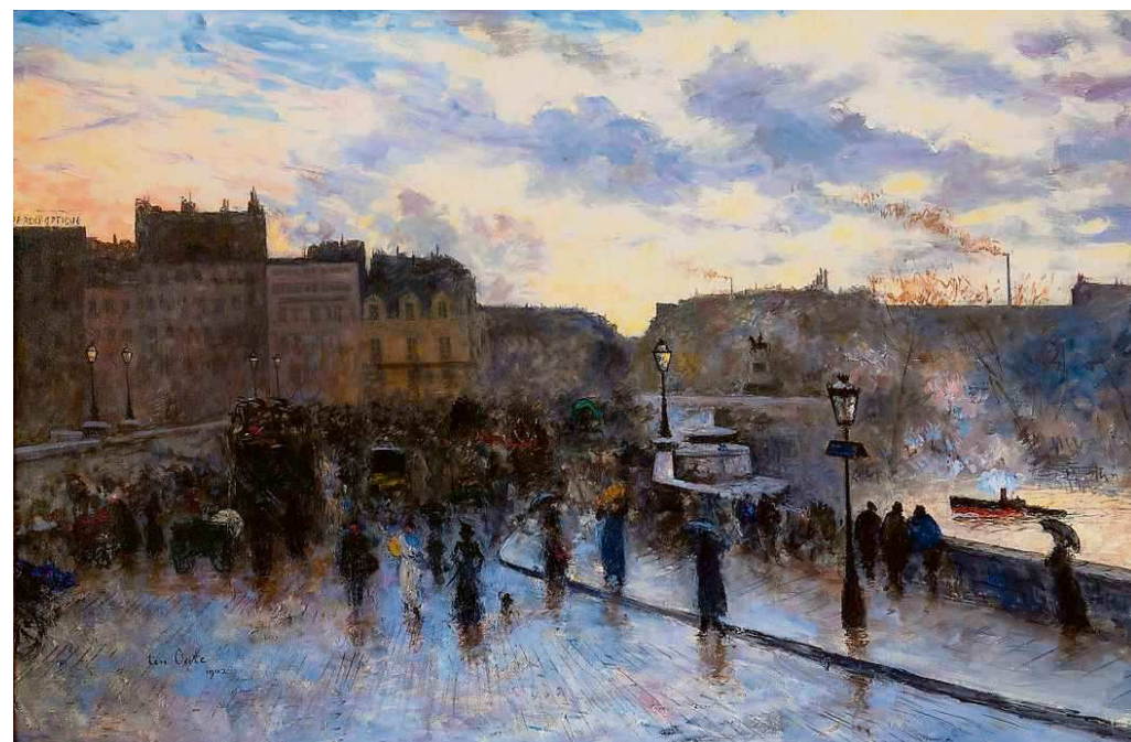
Siebe ten Cate en de reizen die hij maakte. Rechts: het olieverfschilderij Le Pont Neuf dat hij schilderde in 1902. Foto's: Siebe ten Cate Stichting/ Gert-Jan Veenstra (illustratie)